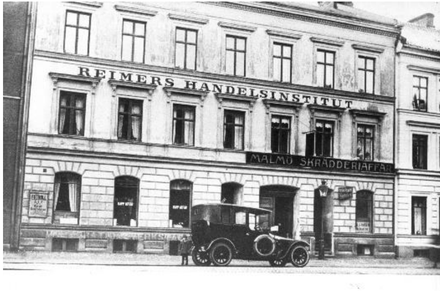
Fastigheten på Kaptensgatan 25. Bilden publicerad i SDS 1915 med anledning av öppnandet av Malmö Skrädderiaffär. 36